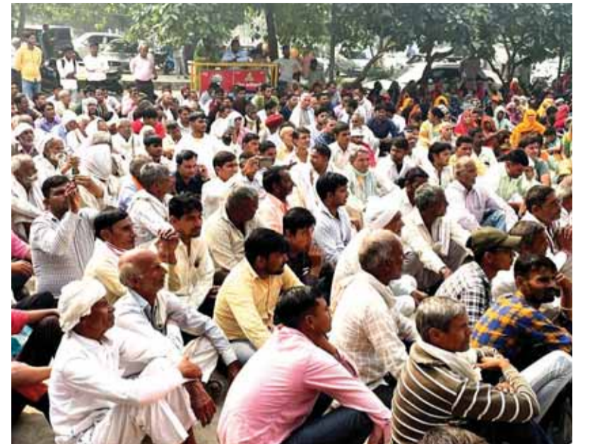
ग्रैटर नोएडा। आज सुबह जेवर एयरपोर्ट के अंतर्गत आने वाले गांव रन्हेरा के किसानों ने विस्थापन और उचित मुआवजे की मांग को लेकर यमुना विकास प्राधिकरण के दफ्तर पर धरना दिया।