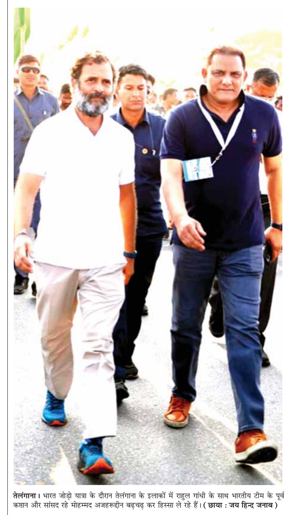
तेलंगाना। भारत जोड़ो यात्रा के दौरान तेलंगाना के इलाकों में राहुल गांधी के साथ भारतीय टीम के पूर्व कप्तान और सांसद रहे मोहम्मद अजरुद्दीन बड़बड़ कर हिस्सा ले रहे हैं।