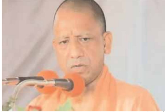
वाली उनवल बाईपास सड़क जनता को समर्पित करेंगे। 3.50

इसके साथ ही सीएम यहां 20.27 करोड़ रुपए की लागत