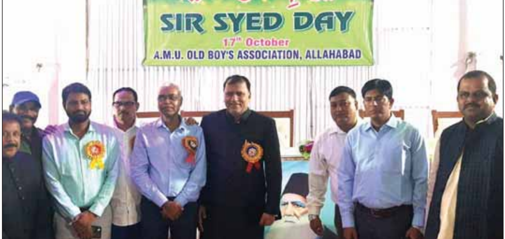
अकबर इलाहाबादी ने सर सैयद को पूरे जीवन बुरा भला कहा आखिरी समय में सिर्फ सर सैयद की तारीफ ही नहीं की बल्कि यह भी कहा हमारी बाँते ही बाँते हैं सय्यद काम करते थे। डॉक्टर आजम बेग ने अलीग बिादरी से हर वर्ष 17, अक्टूबर के दिन से आगे बढ़कर केरियर कोचिंग क्लासेस, स्किल डेवलपमेंट, उच्च एवं आधुनिक शिक्षा के सेंटर स्थापित करने

उन्होंने मुख्य अतिथि के रूप में इलाहाबाद में आयोजित सर सैयद दिवस समारोह को संबोधित किया। उन्होंने इलाहाबाद की ऐतिहासिक महत्ता बताते हुए इलाहाबाद को नेहरू गांधी की धरती कहते हुए अकबर इलाहाबादी से भी जोड़ा और कहा कि देर हो सकती है। लेकिन सत्यता अपने आपको मनवाकर रहती है जिस