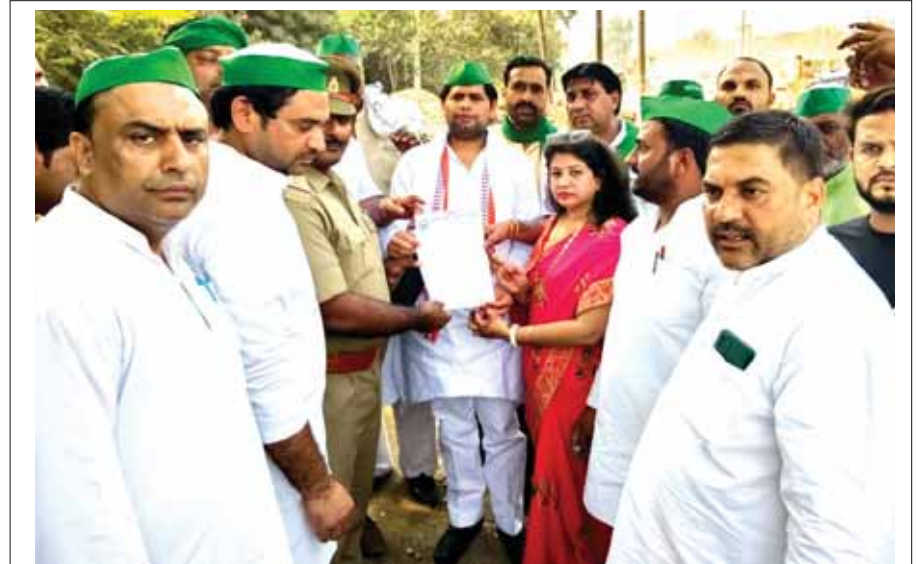
नोएडा। भाकियू ने गहरे गड्डों को लेकर जिलाधिकारी के नाम ज्ञापन सौंपते हुए।

भगवान के बाद अगर कोई भगवान है तो वह डॉक्टर होता है। मुझे लगा कि मैं भी लोगों की सेवा करनी है। उसी दिन से मैं मेडिकल में जाने की बारे में सोचने लगी और ठान लिया कि मेडिकल में ही कैरियर बनाना है। आज जब लोग अच्छे होकर जाते हैं तो दिल को बहुत सुकून की अनुभूति होती है। पिता जी आर टी ओ में कार्यरत हैं और माता ग्रहणी हैं। ड्यूटी से आने के बाद घर के काम में माँ के साथ खाना बनाना अच्छा लगता है। आगे भी मैं लोगों की सेवा करना चाहती हूँ।