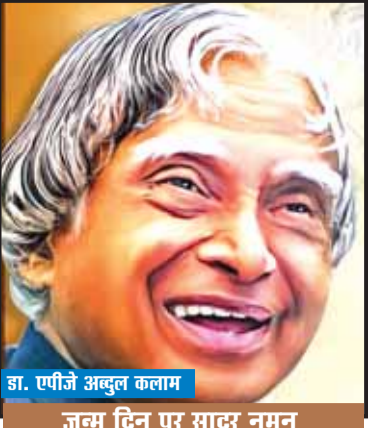
डॉ. ए.पी.जी. अमल कलाम जन्म दिन पर सादर नमन